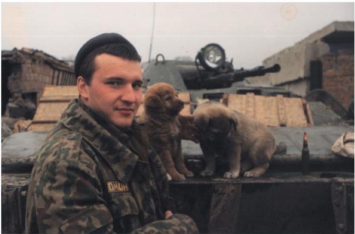
Блокпост №13, г.Грозный.