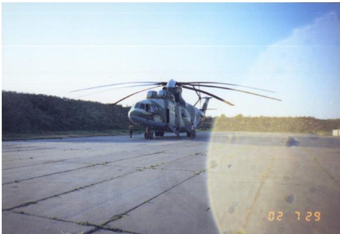
«Двадцать вторая» в Моздоке.