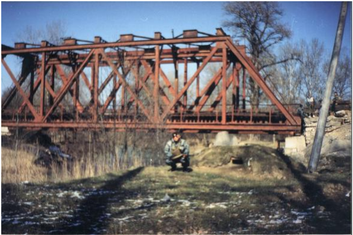
Мост через р.Джалка.